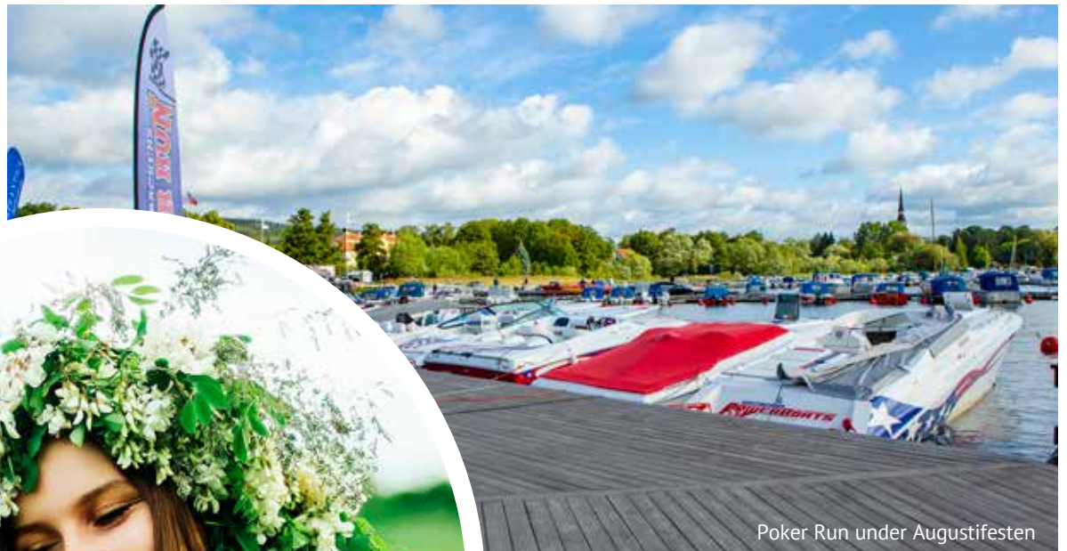
Poker Run under Augustifesten