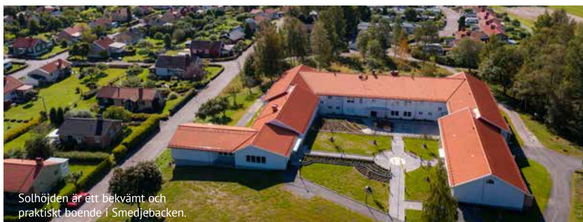
Solhöjden är ett bekvämt och praktiskt boende i Smedjebacken.

Varje månad sammanställs aktuella aktiviteter i en aktivi-