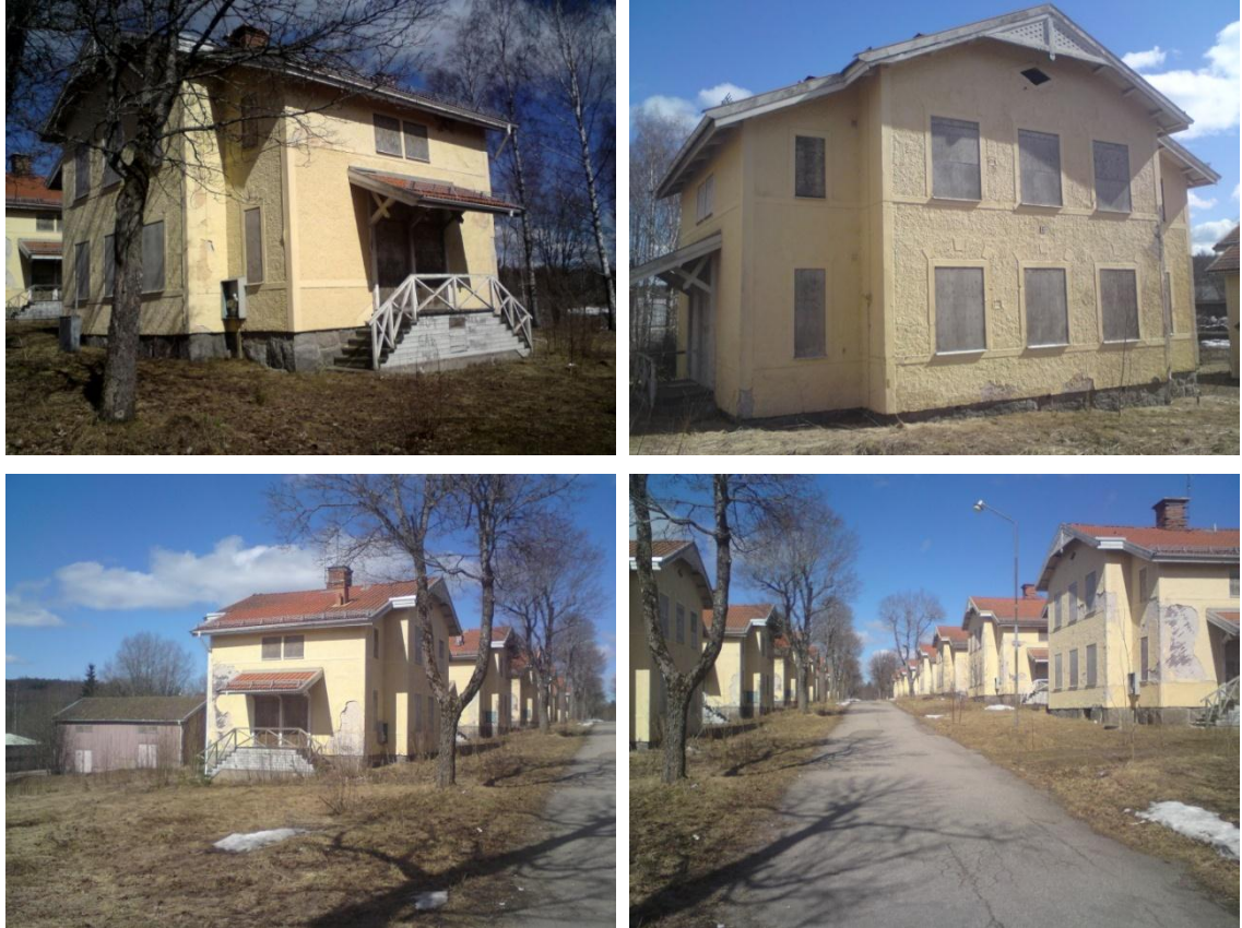
Bild 1-4. Områdets kvaliteter har upphört genom att fastigheten och byggnaderna sjangsarat. Husen har förändrats och av dess ursprungliga träbeklädnad syns inga spår, då husen försetts med puts.

Området består av 22 hus (bilderna 1-4) som tidigare användes som gruvarbetarbostäder, men som nu är mycket nergångna. De uppfördes i slutet av 1800-talet. Inga övriga byggnader än de som nu föreslås till rivning finns inom planområdet.