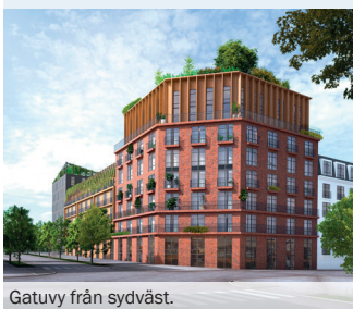
Gatuvy från sydväst.

Markanvisningsavtalet gäller i ett år. Under den tiden ska Koppartallen utreda, förbereda för byggnation samt förhandla om markförvärv.