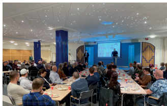
Det var mer eller mindre fullsatt i lokalen.

Symbios definieras som två organismer som behöver och drar nytta av