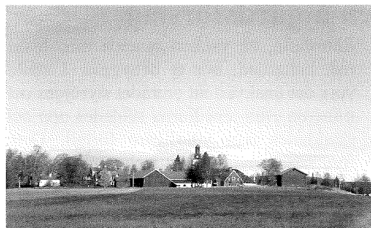
19. Sörå kern med kyrkan i fonden