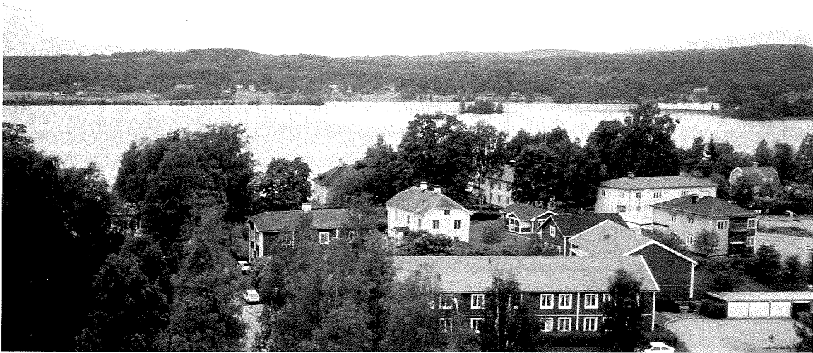
16. Utsikt från kyrktornet med torgbebyggelsen till höger i bild

Odlingslandskapet lever vidare genom en firma i bärodlingsbranschen som förutom odlingarna även förädlar produkterna.