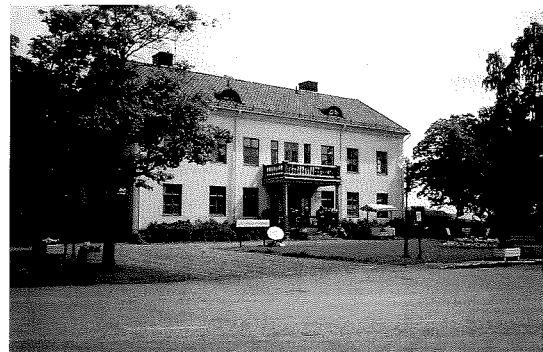
17. Gästis / Grangärdegården

Vidare uppmärksammas Gästgivaregården som tidigare fungerade som tingshus och skola, Sockenstugan med sin 20-tals-klassicismiska stil, Grangärde Herrgård som tillhört Nyhammars Bruk samt de Widikssonska och Olaussonska husen och de bägge sjömagasinen.