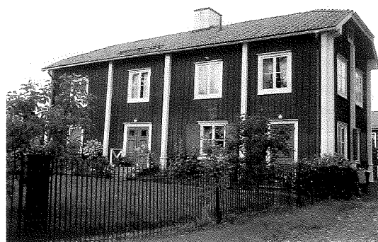
8. Widikssonska huset

Odlingslandskapet söder om kyrkan med sina åkerholmar ger naturupplevelser av stort värde. Den gamla byvägen längs stranden av Bysjön lockar till promenader med vackra och stämningsfulla vyer både till sjöss och land. Området innehåller viktiga symbolvärden för oss Grangärdebor med alla sina byggnader och platser som kan berätta om Grangärdebygdens historia. Kyrkan, torget och platsen Sockenstugan-Gästis har utgjort och utgör fortfarande viktiga knutpunkter för Grangärdeborna.