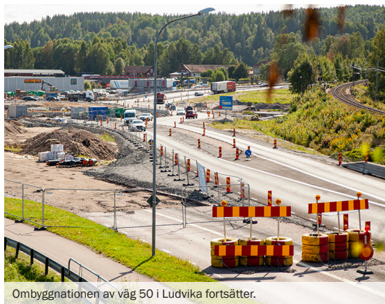
Ombyggnationen av väg 50 i Ludvika fortsätter.

– Det ska sättas upp räcken och ett bullerplank utmed vissa sträckor